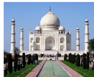
Obrázok 1 K otázke č. 5