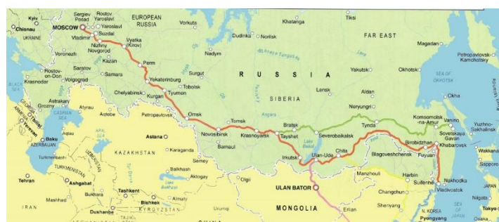
Obrázok 3 K otázke č. 12